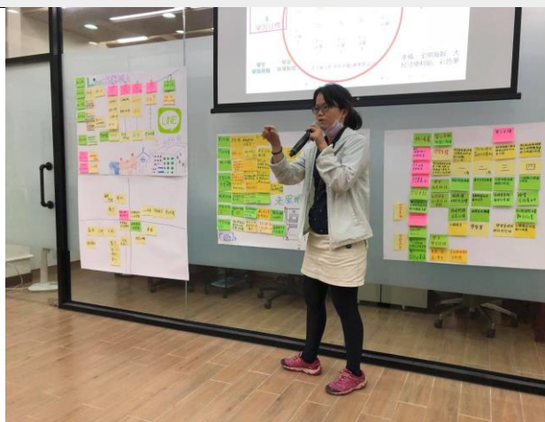
分組討論素養導向教案設計發表。