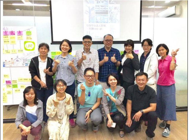
感謝所有參與研習的老師，結束時大合照一張。