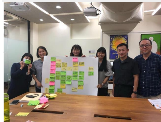
分組討論素養導向教案設計。