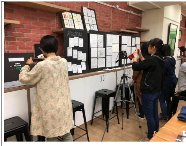
秀峰高中、北門高中、北一女中的博物學方法融入藝術生活教學成果分享展。