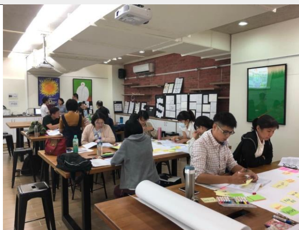
分組討論素養導向教案設計。