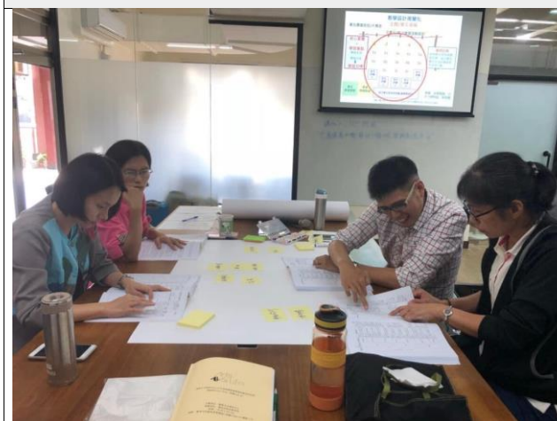
分組討論素養導向教案設計。