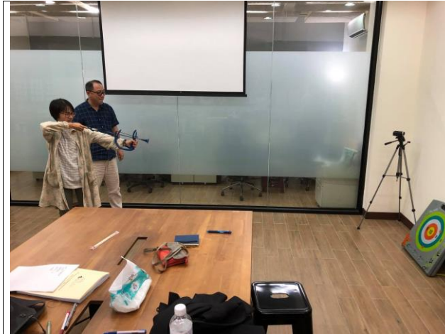
中場休息體驗射箭。