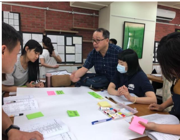
分組討論素養導向教案設計。